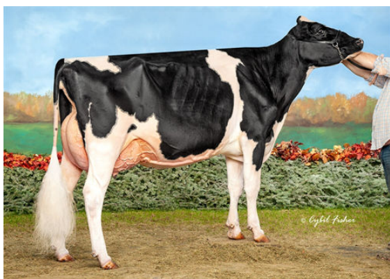
S-S-I DOC HAVE NOT 8783

FULL SISTER TO DAM - SOLD WITH PACKAGE OF PREGNANCIES FOR $1.9M IN JUNE 2022